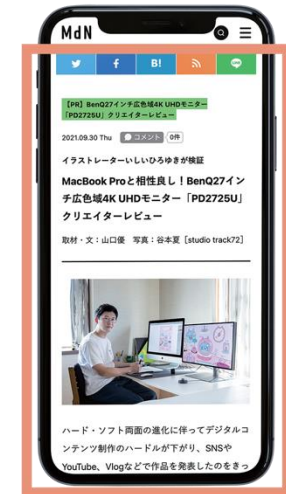
広告記事イメージ