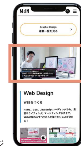
バナー広告イメージ