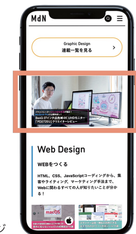
バナー広告イメージ