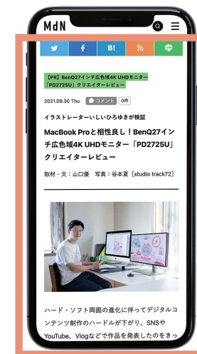
広告記事イメージ